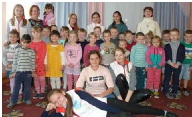
фото юных волонтеров и представителей молодежного волонтерского движения ПГТ Максатиха.

Не забыли мы и о тех пожилых людях нашего микрорайона, которые не смогли прийти в детский сад на праздничный концерт, в силу своей болезни или немощи.